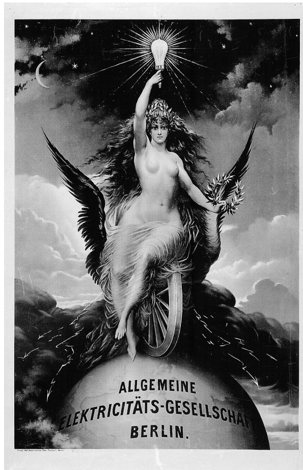
Louis Schmidt, Plakat 1888, Deutsches Historisches Museum, Berlin